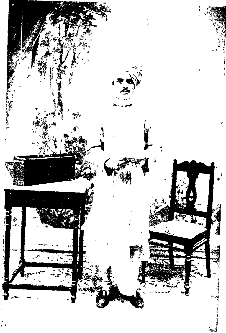
पः रावेऽश्याम कालेन फलानि वि वर ती.